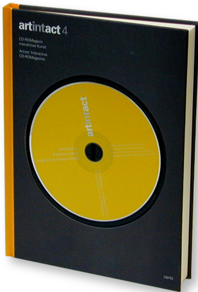
artintact 4 CD-ROM und Buchpublikation, 128 S., englisch/deutsch Hrsg. ZKM | Karlsruhe/ Stuttgart: Cantz, 1997.