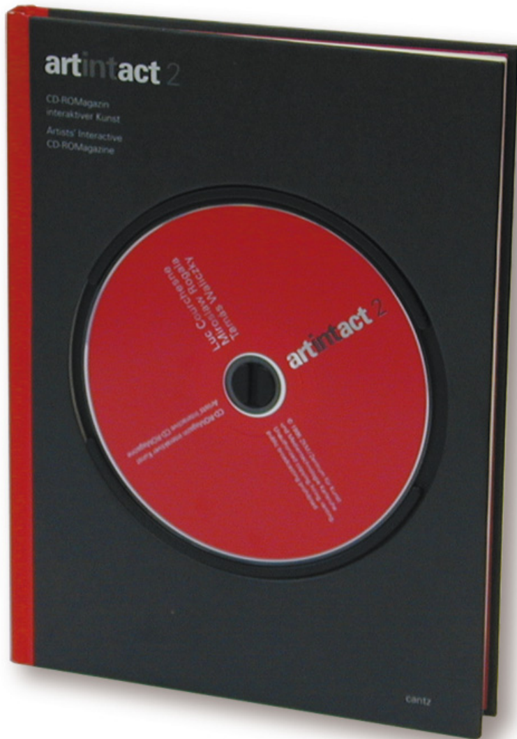
artintact 2 CD-ROM und Buchpublikation, 114 S., englisch/deutsch Hrsg. ZKM | Karlsruhe/ Stuttgart: Cantz, 1995.