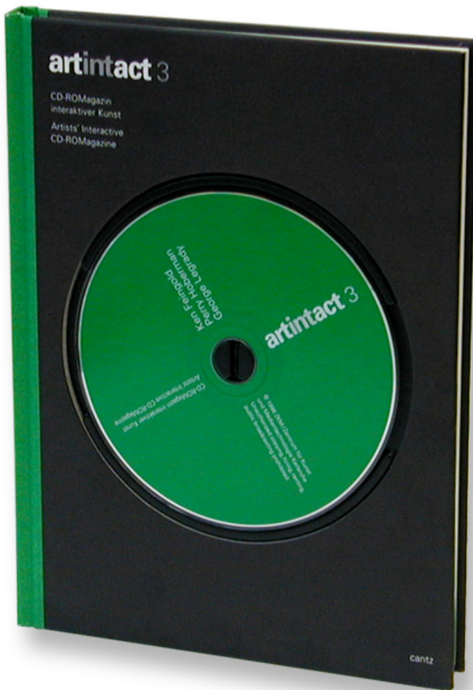
artintact 3 CD-ROM und Buchpublikation, 124 S., englisch/deutsch Hrsg. ZKM | Karlsruhe/ Stuttgart: Cantz, 1996.