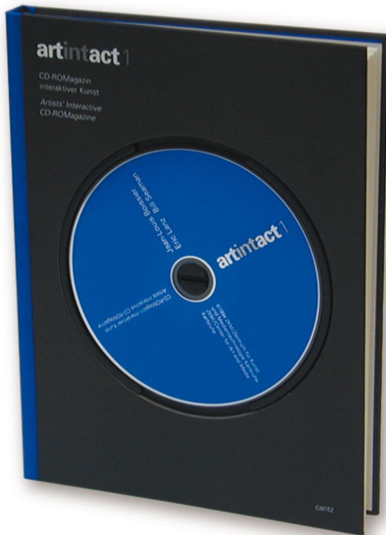
artintact 1 CD-ROM und Buchpublikation, 109 S., englisch/deutsch Hrsg. ZKM | Karlsruhe/ Stuttgart: Cantz, 1994 (2. Auflage: 1997).