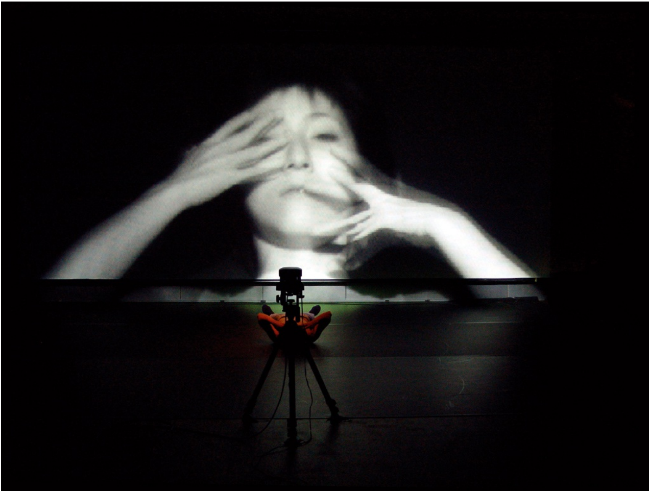
Chris Ziegler: turned (2004) Multimedia-Tanzperformance und elektroakustisches Konzert © Chris Ziegler