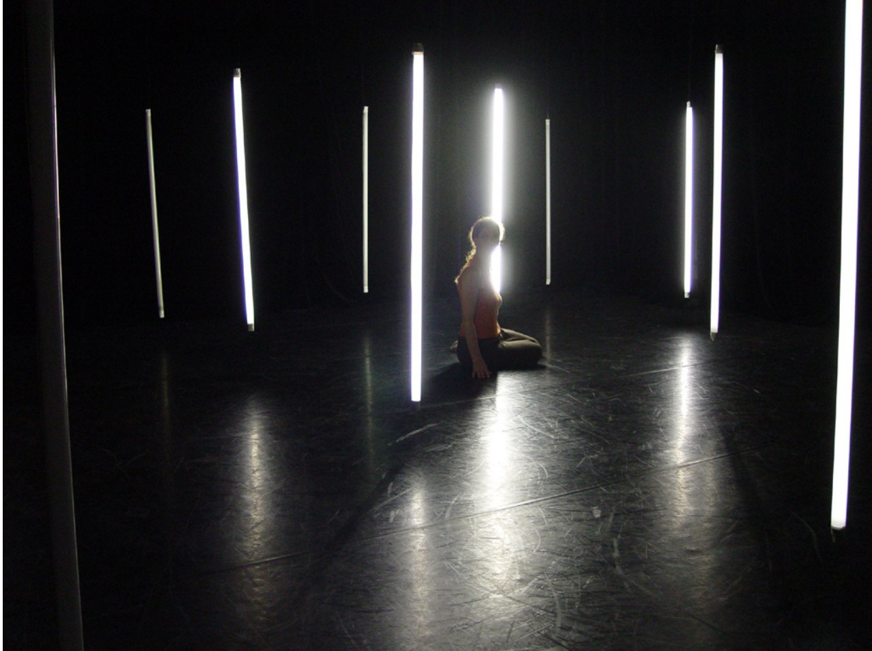
Chris Ziegler: wald - forest Interaktive Tanzperformance/ Interaktive Licht- und Klanginstallation "Proben am Choreografischen Zentrum NRW, PACT Zollverein Essen"